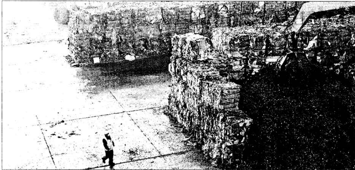
Una grúa recoge los residuos después de que las balas sean trituradas en una máquina especial.